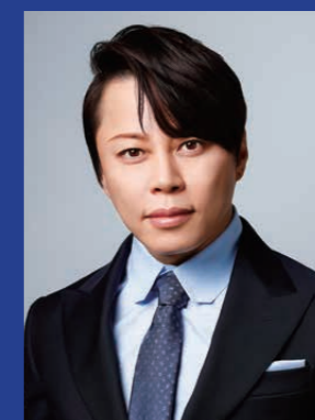
パーソナリティ 西川 貴教